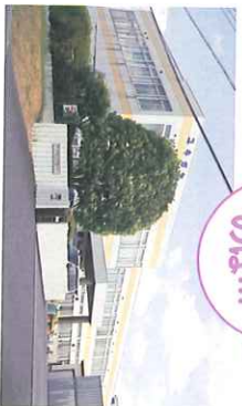
雪ヶ谷化学工業株式会社 つくば工場